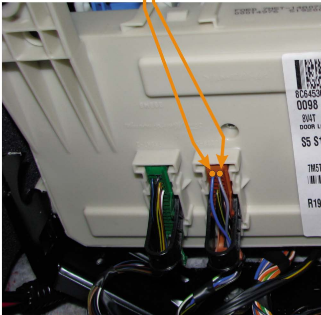
МОДУЛЬ ПЕРЕДНЯЯ ЧАСТЬ (под перчаточным - сторона пассажира)

(активатор багажника) коричневый разъем 46PIN бело-зеленый pin46 ЛЕВАЯ ЛАМПА УКАЗАТЕЛЯ ПОВОРОТА коричневый разъем 46PIN голубой pin32 ПРАВАЯ ЛАМПА УКАЗАТЕЛЯ ПОВОРОТА коричневый разъем 46PIN голубо-красный pin33