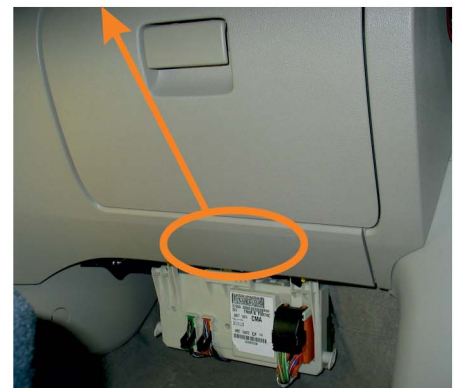
МОДУЛЬ (под перчаточным ящиком - сторона пассажира)