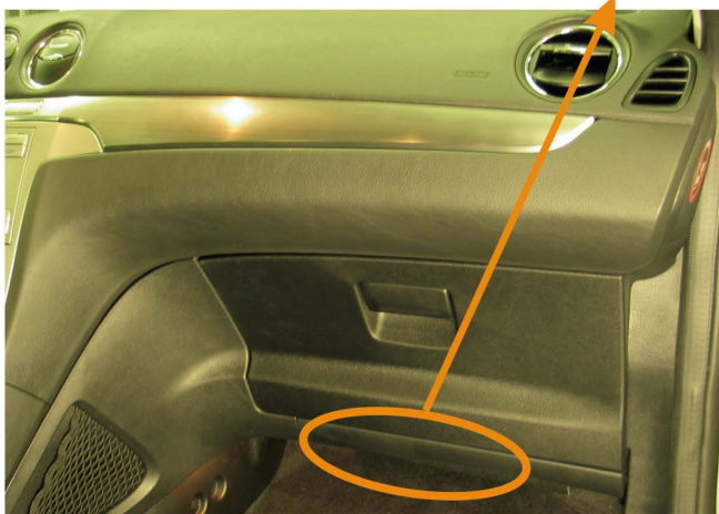
МОДУЛЬ (под перчаточным ящиком - сторона пассажира)