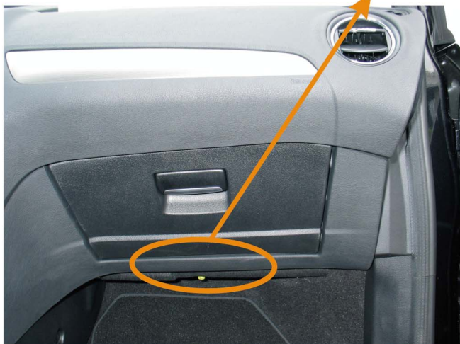
МОДУЛЬ (под перчаточным ящиком - сторона пассажира)