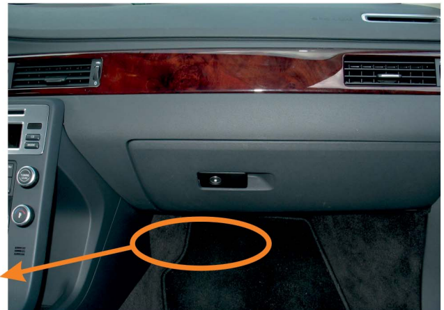
МОДУЛЬ (под перчаточным ящиком - сторона пассажира)